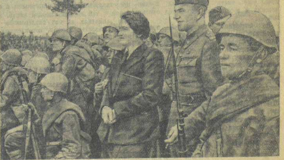
Председатель Союза польских патриотов Ванда Васильевская посетила лагерь польской дивизии им. Тадеуша Костюшко. На снимке: Ванда Васильевская и командир польской дивизии полковник С. Берлинг среди польских солдат наблюдают за учебной стрельбой.